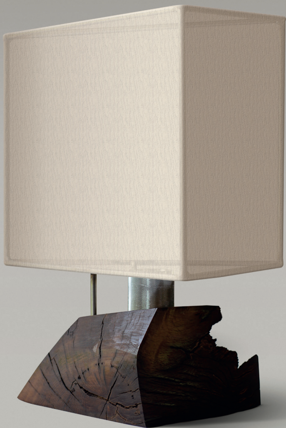
Lampade da tavolo Le Vele The Vele table lamps