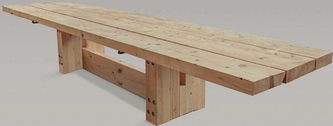
Tavolo da esterno Ali Ali Outdoor table