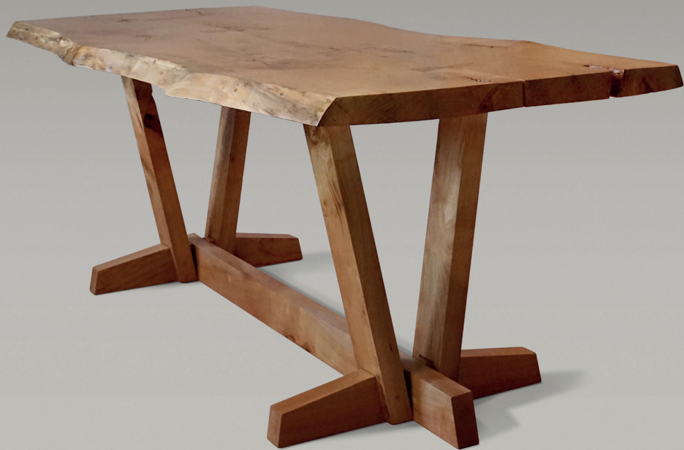
Tavolo Farfalla The Farfalla table