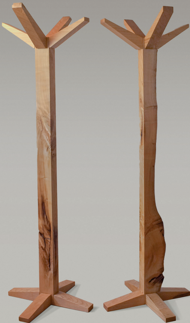
Appendiabiti Albero The Albero Coat rack