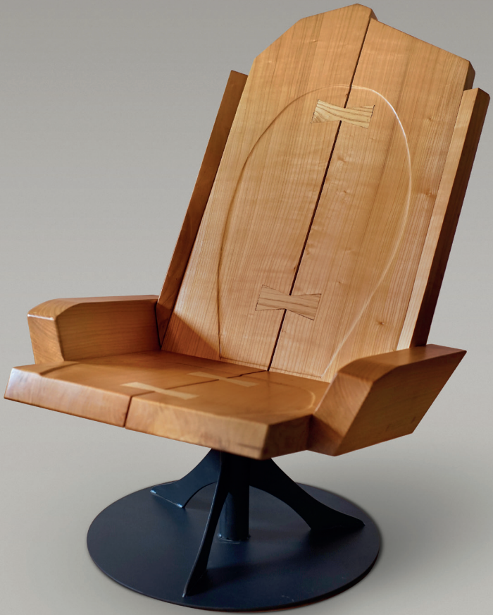
Poltrona rotante Pensieri The Pensieri rotating armchair