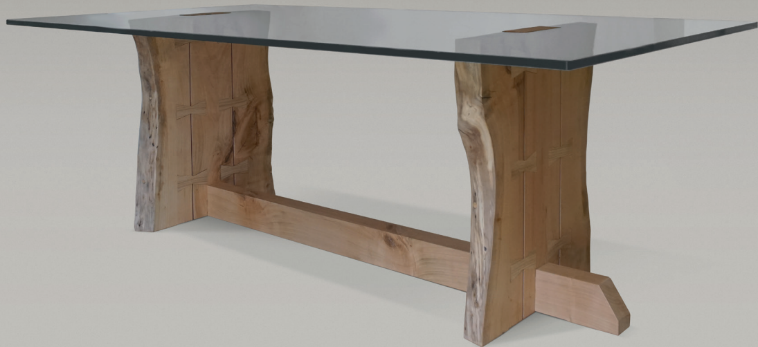
Tavolo Aria The Aria table