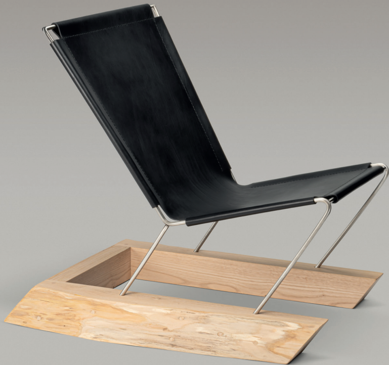
Poltrona Zero G The Zero G armchair