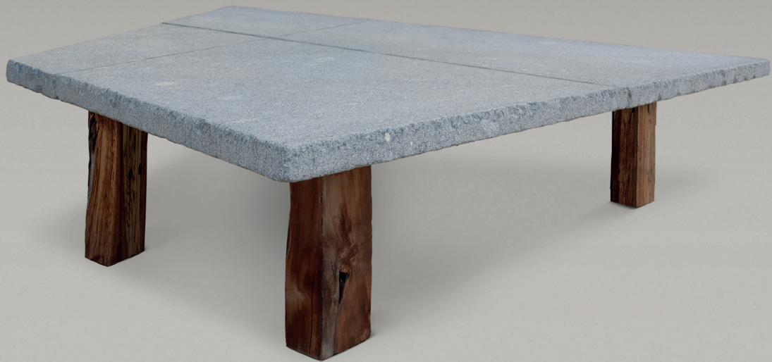
Tavolo Trapezio The Trapezio table